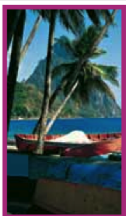
LES ÎLES SAINTE-LUCIE, SAINT-VINCENT ET LES GRENADINES Pages 186-203