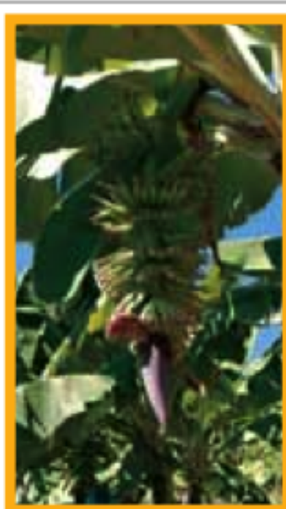
LE NORD ATLANTIQUE Pages 122-147