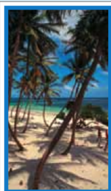
LE SUD ATLANTIQUE Pages 168-185