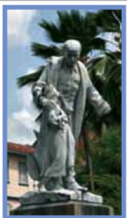
FORT-DE-FRANCE Pages 72-93