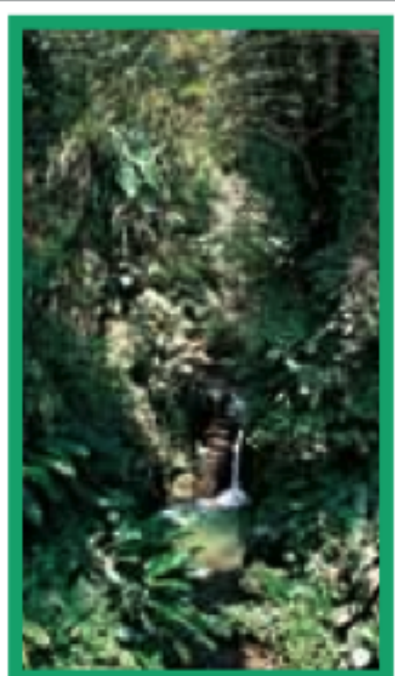
LE NORD CARAÏBE Pages 94-121