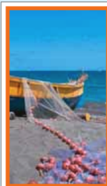
LE SUD CARAÏBE Pages 148-167